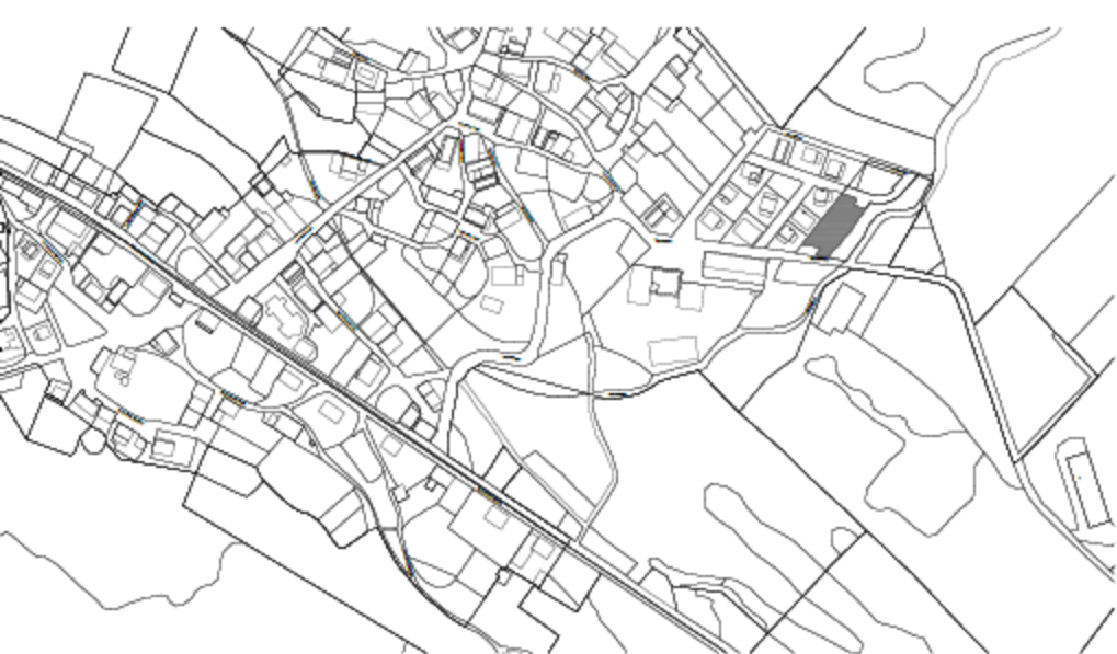
PLANO DE SITUACIÓN ① Escala 1:200