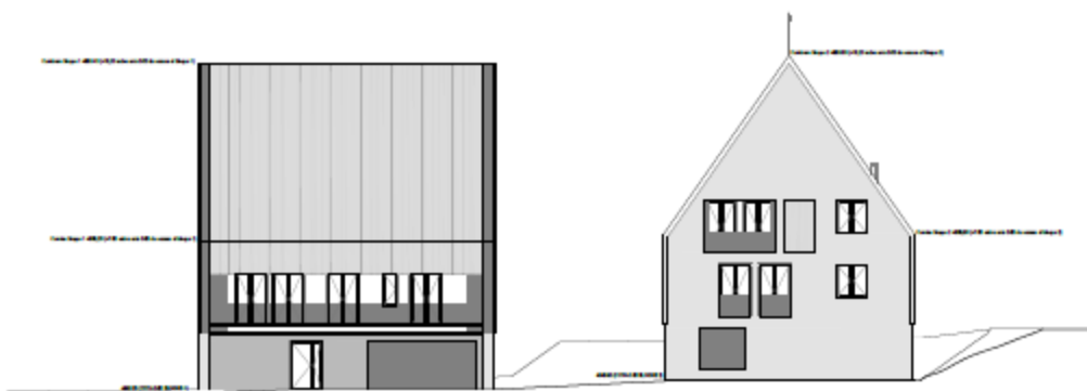
SECCIÓN A POR LA PARCELA POR LÍMITE SURESTE Escala 1:200